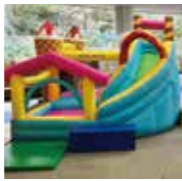
ゆ〜ゆキッズパーク(玉湯町)