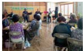
八雲台のなごやか寄り合い会

地域の高齢者の方が集い、行事を通じて、つながりを持ち、仲間づくり、生きがいづくり、悩み解決、介護予防などにつながる機会として企画されています。私もできる限りお手伝いに行っています。