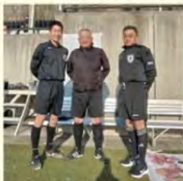
サッカー審判活動