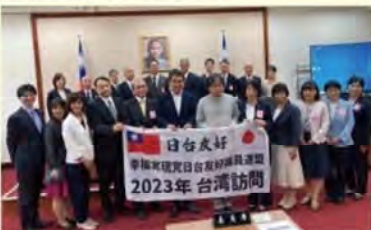
日台友好議員連盟 訪台活動