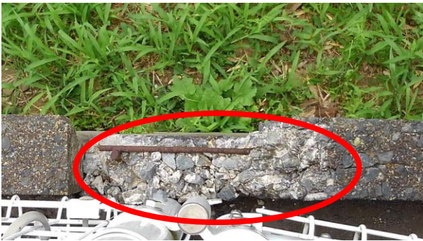
劣化して崩れている自転車置場土台外壁（令和3年8月）

令和3年8月に古館駅東口駐輪場整備工事の請負契約の締結が、議題に上がりました。このとき、駐輪場の土台がかなり劣化していることを申し上げたところ、後日、古館駅東口駐輪場整備工事の変更請負契約の締結に至り、土台部分の工事も行われました。