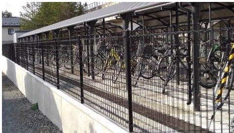
現在の自転車置場（令和5年4月）