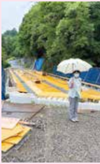
橋梁の長寿命化についての調査