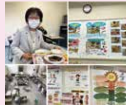
給食センター視察