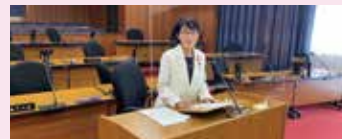
市議会定例会でこれまでの行った一般質問39問