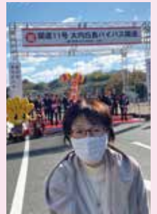
R3,12,18 国道11号大内白鳥バイパス 松崎～土居区間 開通