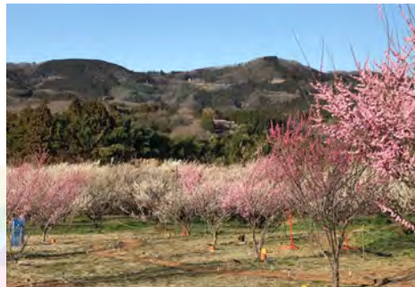
大切にしたい秋間梅林