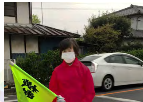
朝の通学の見守り。子供は地域の宝です。