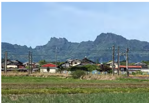
妙義山のふもとに広がる安中市