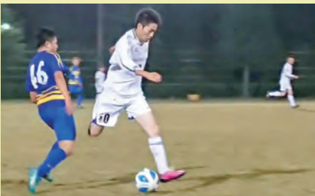
▲ サッカー試合(佐伯リーグの試合風景)