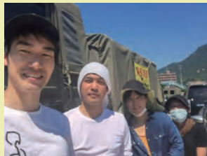
▲ 水害ボランティア