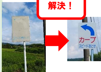
市道0108号線(下小津田から車地区)の道路標識の新設